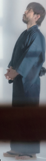
脚本・演出 亀尾佳宏