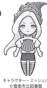
キャラクター・ミツシエル ©雲南市立図書館

図書館や博物館に行って、 いろいろな貝を見つけよう！ シールを集めて、貝の標本 カードを完成させよう！