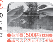
●参加費：500円(材料費) ●持ってくるもの：水筒

カイお兄さんと一緒に、レジンを使ったアクセサリをつくってみよう！※申込時に希望の種類をお伝えください。(ネックレスまたはキーホルダー)