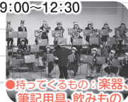
●持ってくるもの：楽器、筆記用具、飲みもの

吹奏楽部を引退した3年生、集合！普段なかなかできない大編成の曲(宝島、ティズニー、吹奏楽の名曲など)をたくさん演奏しましょう！高校生や大人と一緒に、12/24のクリスマスコンサートにも出演します♪